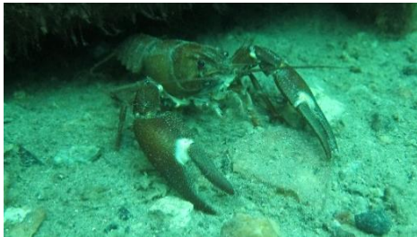
Hej och välkomna hit!

Det blev bara några minuter försenat på grund av snöfallet. Vi klär om och går i vattnet. Sikten är ca 10 meter och det är 7 grader varmt. Riktigt gossigt. Vi simmar ner till tunneln på 40 meters djup och simmar sakta upp och tittar på alla saker som ligger i brottet. Efter 50 minuter är det dags att gå upp. Det har börjat snöa riktigt ordentlig så grillkorven smakade extra gott efter dyket.