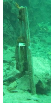
Vem har tappat ankaret?