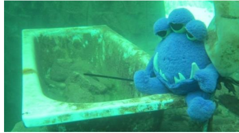
Kanske dags för ett bad?