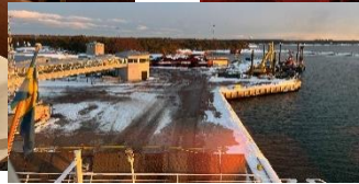
Nu har vi kommit till Åland